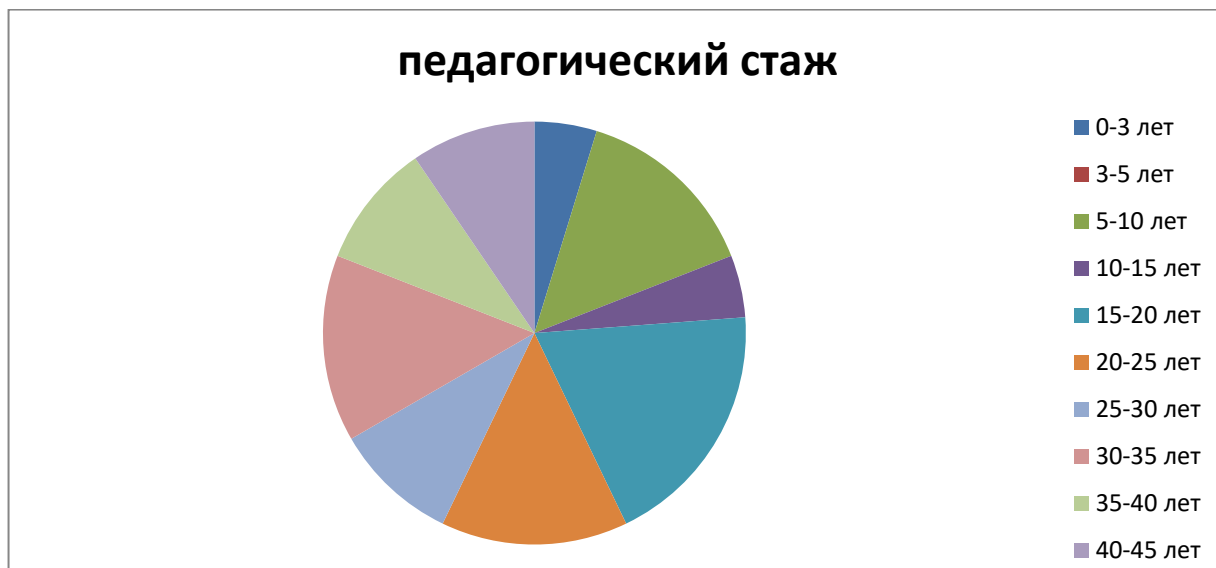
Диаграмма с характеристиками кадрового состава ДОУ

определяется самим воспитателем в соответствии с его потребностями и интересами. Результаты работы по самообразованию – источник пополнения методического кабинета. Это и конспекты занятия, планы разнообразных видов деятельности, дидактические игры.